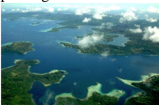
Luchtfoto van de Salomonseilanden

Ander voorbeeld zijn de Salomonseilanden, een voormalig Brits protectoraat in de Stille Oceaan. Zij proberen te herstellen van een burgerconflict dat het land op de rand van instorten bracht. De Wereldbank zegt dat de Salomonseilanden, een van de armste landen in de Stille Oceaan, zijn getroffen door opeenvolgende wereldwijde voedsel-, brandstof- en financiële crises. Je kunt je afvragen waarom de ongeveer 600.000 inwoners van Solomon Islands 500 verschillende postzegels en 150 verschillende postzegelvelen per jaar nodig hebben. Omdat ze die niet echt nodig hebben, en daarom de meeste dan ook niet gebruiken, kunnen we concluderen dat ze zijn uitgegeven om de minst geïnformeerde, meest naïeve postzegelverzamelaars ter wereld uit te melken.