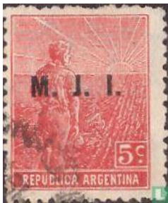
Ministerie van justitie: Uitgave van deze serie van 1912