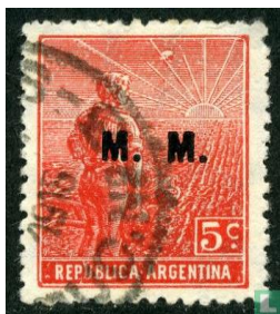
Ministerie Amerika Servies Uitgave van deze serie van 1920-1923