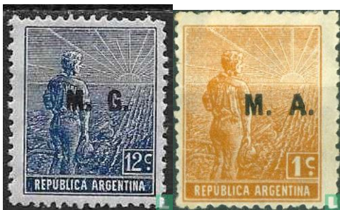
2x Ministeriee Agricultuure Uitgave van deze serie van 1912