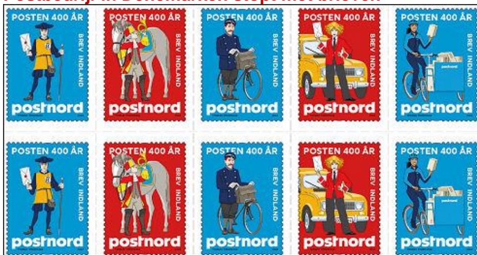
PostNord: Herinnering aan 400 jaar post in Denemarken

Het voormalige staatspostbedrijf van Denemarken PostNord stopt met ingang van 2026 met de bezorging van brieven en kaarten. Daarmee komt een eind aan meer dan vierhonderd jaar postbezorging. Het bedrijf gaat verder als pakketdienst. Vijftienhonderd medewerkers worden ontslagen. Kan dat ook in Nederland gebeuren bij PostNL?