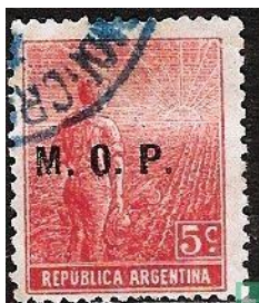
Ministerie Affairs Religion Uitgave van deze serie van 1923